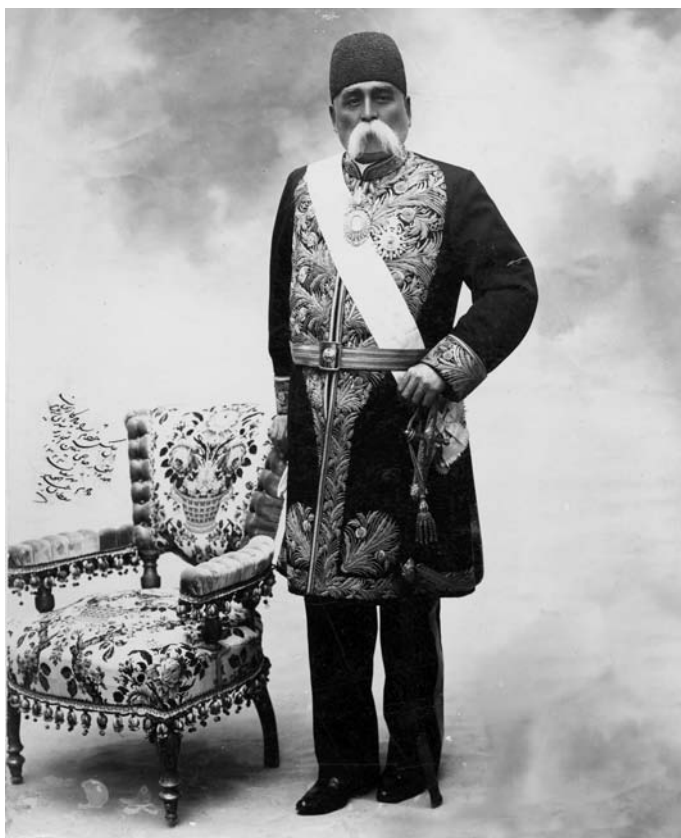
عین‌الدوله، ۱۳۲۳ق [۱۳۰۳-۱ع]

بود. این گونه اقدامات به‌طور پراکنده از سالهای نخست فعالیت بانک استقراضی آغاز شده بود و هر از چندگاه مواردی پیش می‌آمد که اولیای این بانک در توافق و یا بدون هماهنگی با اولیای حکومت مرکزی ایران قروض برخی افراد متنفذ را در جمع قروض حکومت به حساب می‌آوردند. ۱۱۲ چنانکه عین‌الدوله صدراعظم مظفرالدین شاه هم، که گویا جهت مصارف جاری دربار با تضمین شخصی مبالغ هنگفتی از بانک استقراضی وام